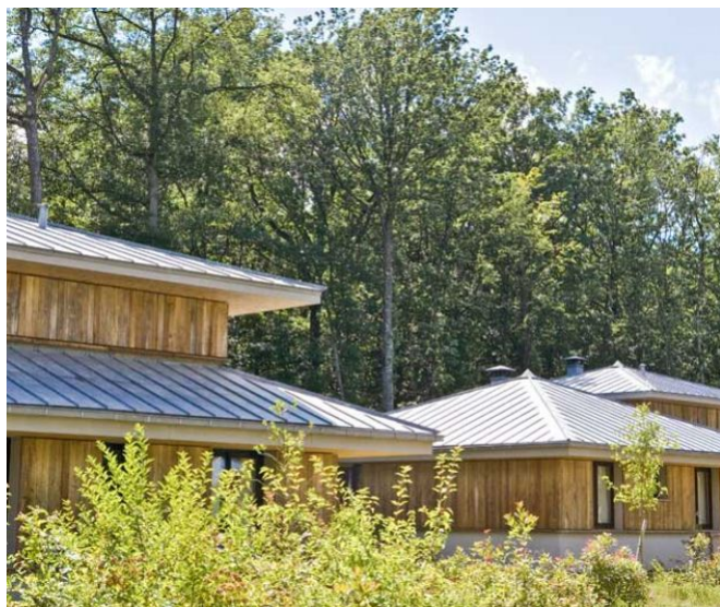
Domaine Les Bois-Francis, Normandie, Verneuil sur Avre et d'Iton